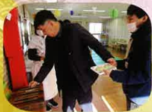
お賽銭箱にお金を 入れて……。

新年会は、蛸のダイニングにできた神社にお参りをしました。 それぞれ絵馬に願い事を書きました。