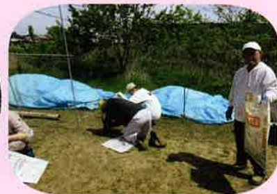
暖くなり、農作業にも力が入ります！