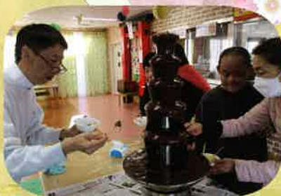
甘くておいしくて、大人気♪