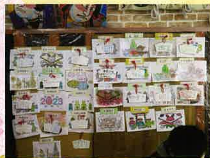
最後は、絵馬に願い事を書 いて飾りました