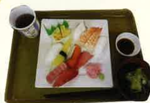
マグロ、数の子、海老、サ ーモン、イカ、タコ、玉子 数の子のプチプチ食感が最高！