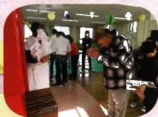
鳥居の前で願いごとを しました！