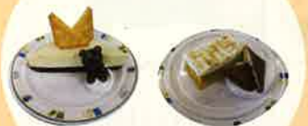
チーズケーキ かぼちゃケーキ