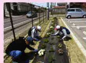
花壇もにぎやかになっていきます！