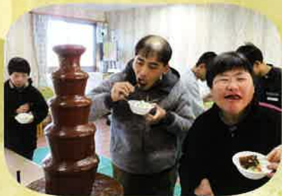
お楽しみ会ではチョコレート フォンデュをつくりました！