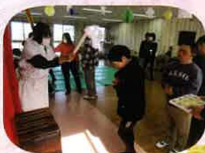
おはらいもしてもらいました。 いい年になるといいね！